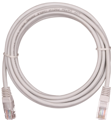
EC-PC4UD55B-BC-LSZH-XXX-GY-10 Коммутационный шнуры NETLAN U/UTP, Кат.5е, RJ45-RJ45, LSZH, медь

Коммутационные шнуры состоят из отрезка многожильного патч-кабеля, оконцованного разъемами типа RJ45/8P8C. Разводка кабеля в коммутационных шнурах произведена по стандарту T568B. Место крепления коннектора в шнурах NIKOMAX защищено заливным колпачком, что существенно увеличивает срок службы патч-корда.